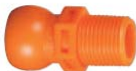
Внешний вид соединителя 84066

Описание: соединитель для системы с внутренним диаметром 1/2" с наружной резьбой РТ 3/8"