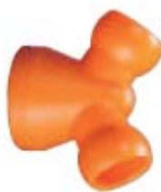
Внешний вид переходника Y-образного 86079

Описание: Переходник Y-образный для соединения системы с внутренним диаметром 3/4" с двумя системами с внутренним диаметром 1/2"