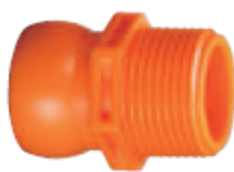
Внешний вид соединителя 86074А

Описание: соединитель для системы с внутренним диаметром 3/4" с наружной резьбой NPT 3/4"