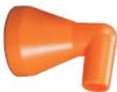
Внешний вид сопла углового 84464

Описание: сопло круглое угловое 90° для системы с внутренним диаметром 1/2" и диаметром на выходе 3/8"