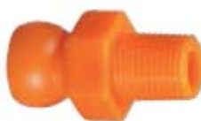
Внешний вид соединителя 82035

Описание: соединитель для системы с внутренним диаметром 1/4" с наружной резьбой РТ 1/8"