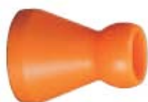
Внешний вид переходника 86071

Описание: Переходник для соединения системы с внутренним диаметром 3/4" с системой с внутренним диаметром 1/2"