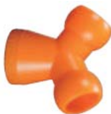
Внешний вид соединителя Y-образного 84068

Описание: Соединитель Y-образный для системы с внутренним диаметром 1/2" и двумя разветвителями 1/2"