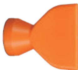
Внешний вид сопла плоского 84079

Описание: сопло плоское для системы с внутренним диаметром 1/2" и размером 1 5/8" на выходе