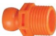
Внешний вид соединителя 83056

Описание: соединитель для системы с внутренним диаметром 3/8" с наружной резьбой РТ 1/2"