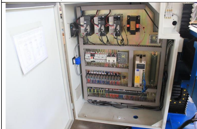
Электрощкаф по нормам СЕ