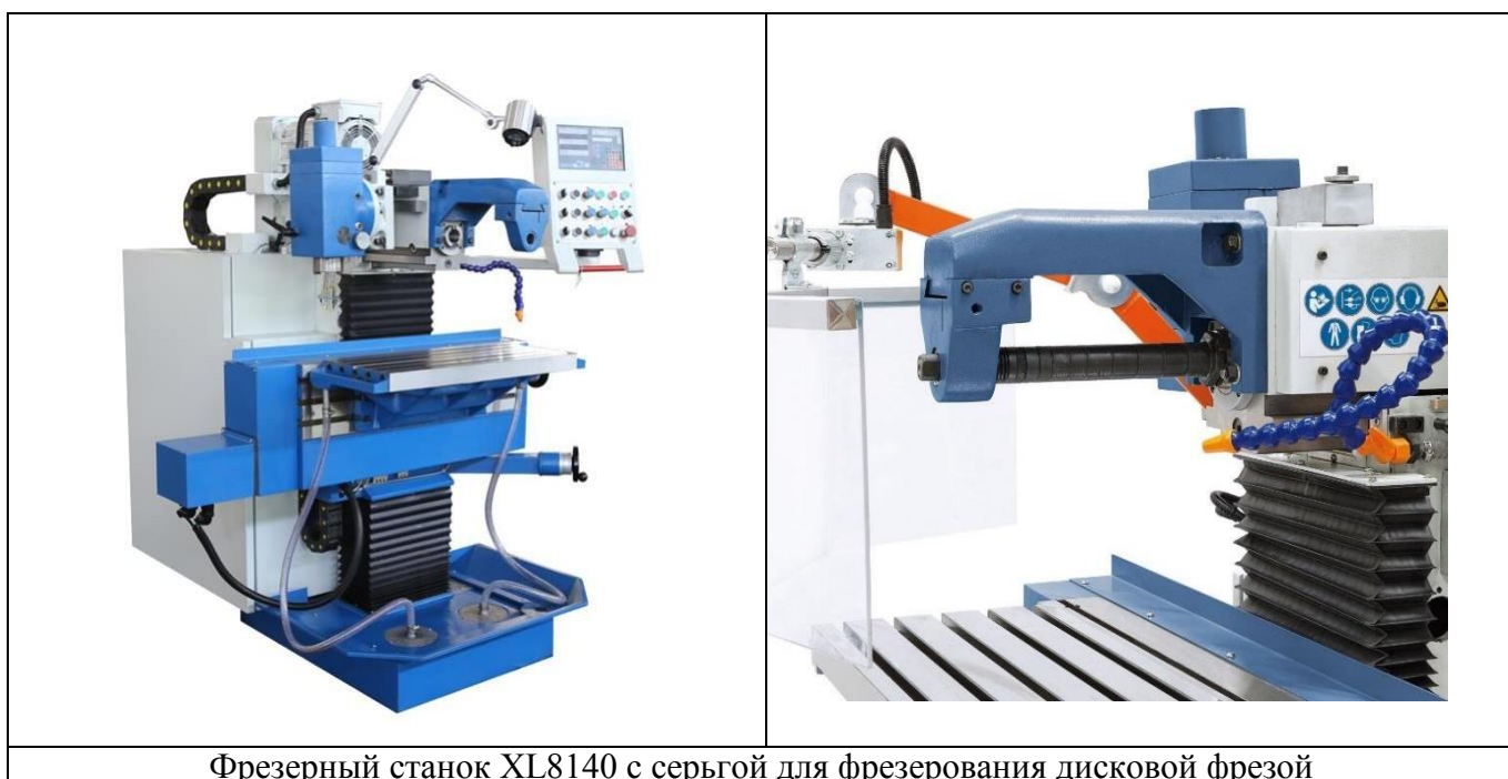
Фрезерный станок XL8140 с серьгой для фрезерования дисковой фрезой