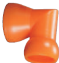
Внешний вид соединителя углового 64640