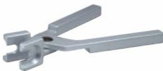
Внешний вид клещей сборочных 26171