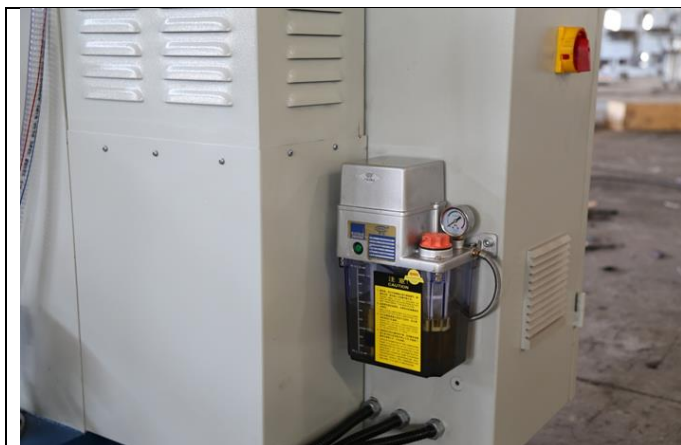
Станция автоматической смазки