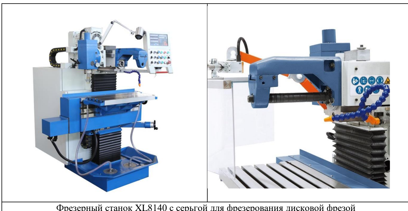
Фрезерный станок XL8140 с серьгой для фрезерования дисковой фрезой