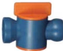
Внешний вид крана проходного 86742