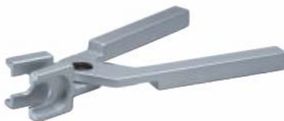
Внешний вид клещей сборочных 26176