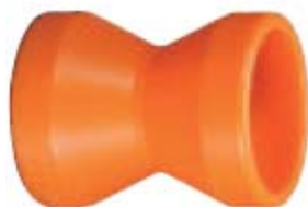
Внешний вид переходника двустороннего 84031

Наименование: Переходник двусторонний 1/2"