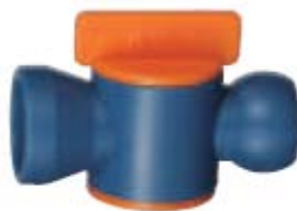
Внешний вид крана проходного 84742