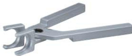
Внешний вид клещей сборочных 26177