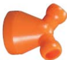
Внешний вид переходника Y-образного 84069

Описание: Переходник Y-образный для системы с внутренним диаметром 1/2" и двумя разветвителями 1/4"