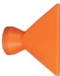
Внешний вид сопла плоского 84072

Описание: сопло плоское для системы с внутренним диаметром 1/2" и размером 2 1/2" на выходе