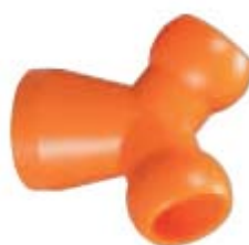
Внешний вид соединителя Y-образного 83058

Описание: Соединитель Y-образный для системы с внутренним диаметром 3/8" и двумя разветвителями 3/8"