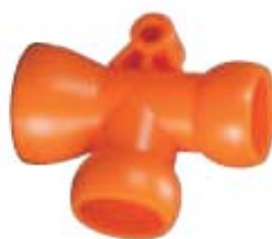
Внешний вид соединителя Т-образного 64646

Описание: Соединитель Т-образный для системы с внутренним диаметром 1/2" и двумя разветвителями 1/2"