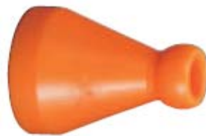
Внешний вид переходника 84851

Описание: Переходник для соединения системы с внутренним диаметром 1/2" с системой с внутренним диаметром 1/4"